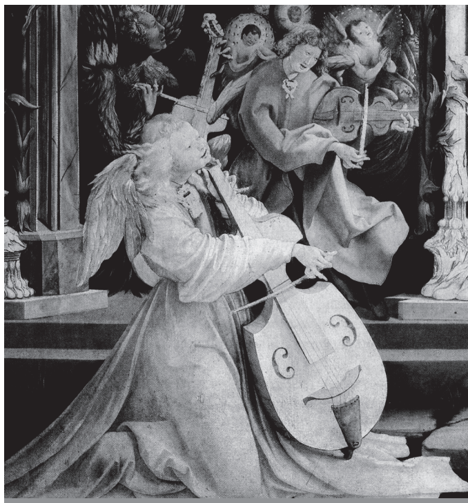
Musée d'Unterlinden w Colmarze

Podaj nazwy dwóch odmian wioli, na których grają aniołowie przedstawieni na ilustracji.